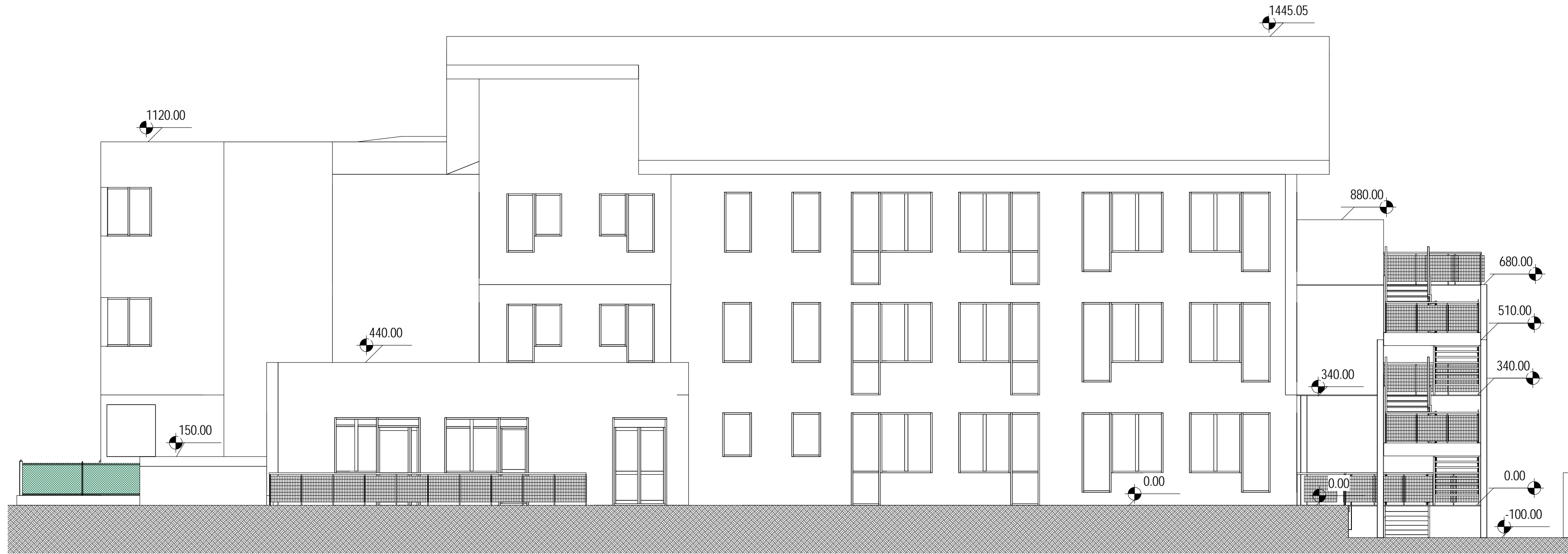
4 Prospetto Sud 1 : 100