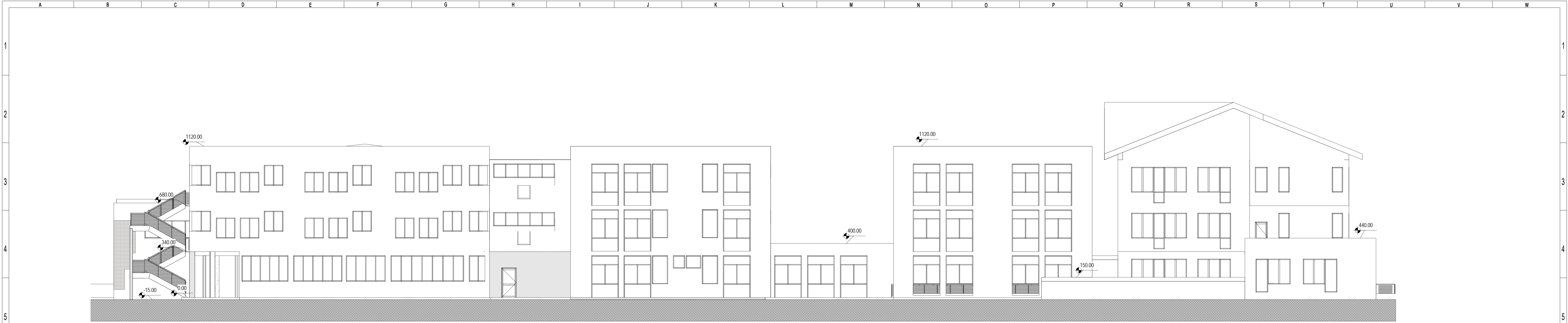
1 Prospetto Ovest 1 : 100